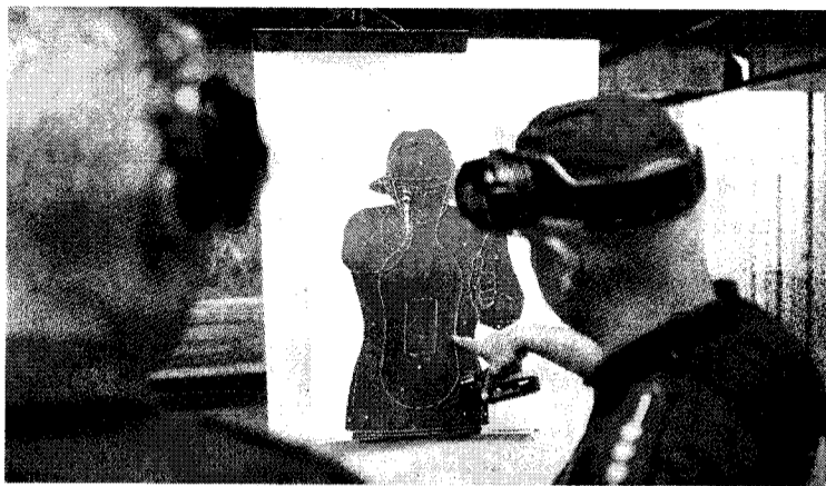
• Dotąd Szkoła Policji nie kojarzyła się z tego rodzaju problemami. Teraz pracownicy Szkoły powiadomili Biuro Spraw Wewnętrznych

Policyjna placówka zatrudnia około 240 funkcjonariuszy oraz pracowników cywilnych. 200 z nich zapisało się do Pracowniczej Kasy Zapomogowo-Pożyczkowej. Każdy z członków PKZP co miesiąc odprowadza na jej konto składkę wynoszącą 3 proc. swojego wynagrodzenia. I dzięki temu po półrocznym członkostwie w kasie może ubiegać się o przyznanie nieoprotentowanej pożyczki.