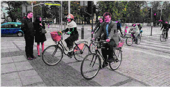
Rowerzy miejskie mają wyjechać na ulice Częstochowy wiosną przyszłego roku

Według obecnych planów pierwsze 20 minut jazdy na rowerze będzie darmowe