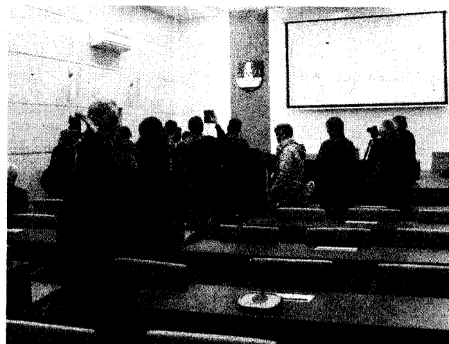
► Tak prezentuje się sala obrad czeladzkiej Rady Miejskiej z nowoczesnym wyposażeniem oraz systemem nagłośnienia

A okazją do tego była wyjątkowa, bo w miniony piątek każdy mógł zajrzeć m.in. do miejskiego archiwum, zobaczyć jak prezentuje się nowa strefa obsługi klienta, zasiąść w ławach sali sesyjnej Rady Miejskiej, a także sprawdzić, czy fotel w gabinecie burmistrza jest wygodny. Otwar-