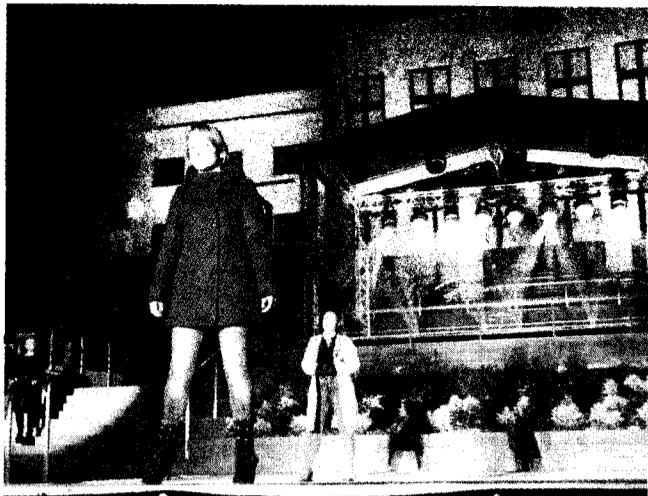
► Uroczystemu otwarciu Urzędu Miasta po generalnym remoncie towarzyszył między innymi pokaz mody

Obecna siedziba władz miasta powstała w 1971 r., w czasach głębokiego PRL-u i nigdy nie doczekała się remontu. W tym cza-