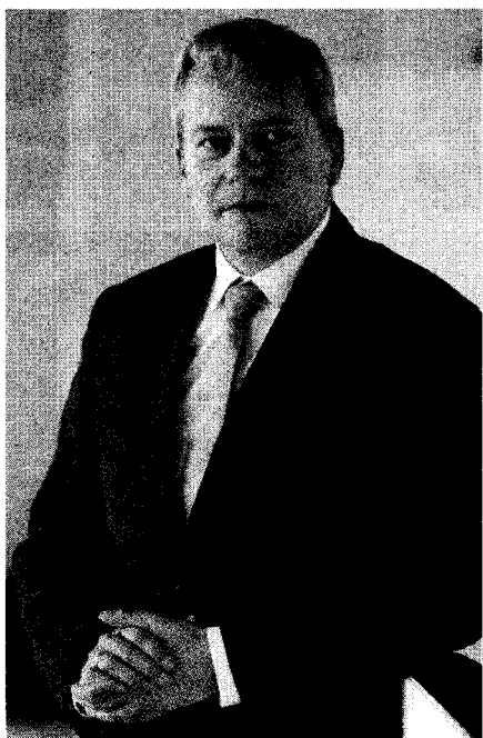
Marszałek Wojciech Saługa

Województwo śląskie należy do krajowych liderów, jeśli chodzi o wynalazki w skali całej Polski – zgłoszone i udzielone prawa ochronne, nakłady na działalność innowacyjną czy przedsiębiorstwa korzystające z e-administracji. Kładziemy duży nacisk na rozwój jednostek w działalności badawczej i rozwojowej. Nasz region jest w czołówce kraju pod względem liczby osób zatrudnionych w działalności badawczo-rozwojowej.