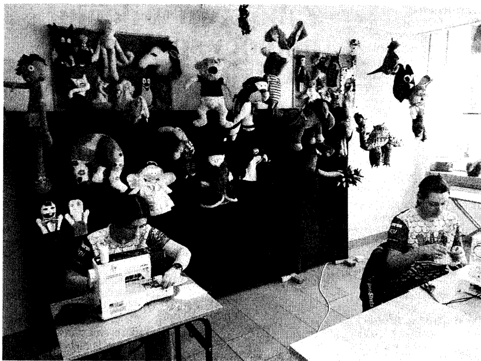
W szycie maseczek ochronnych dla szpitala zaangażowało się około 25 wychowanek