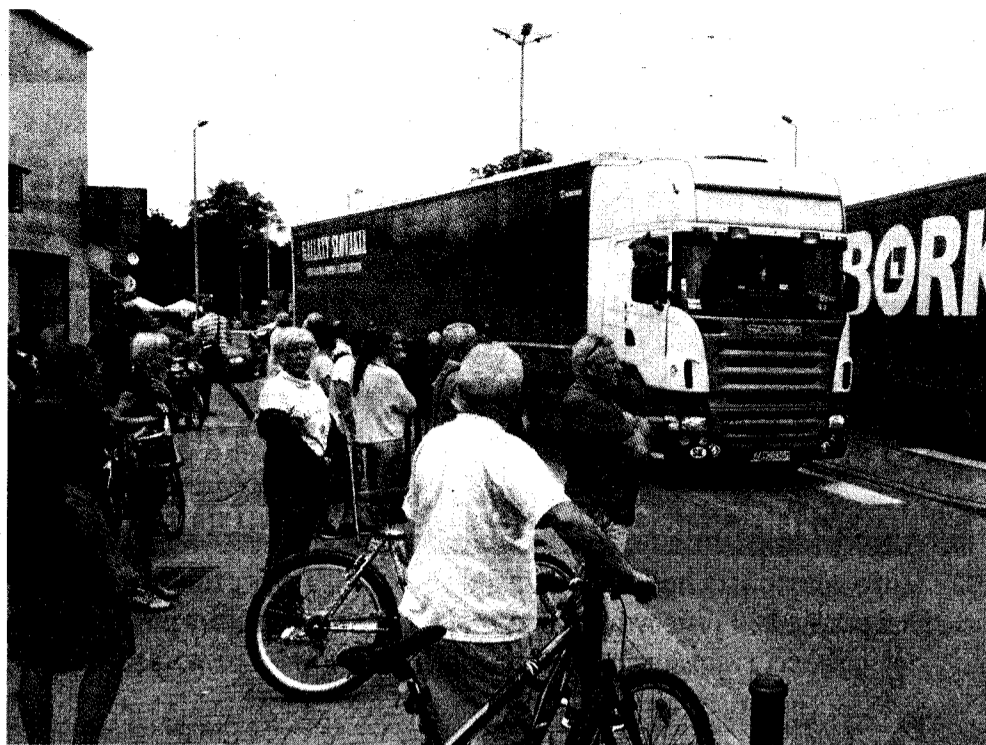
Centrum Węgierskiej Górki. Tiry i ciężarówki rozjeżdżają tę miejscowość. A obejścia wciąż nie ma

Jaskinia Malinowska to jedna z niewielu w Beskidach, które mają korytarze o rozwinięciu zarówno wertykalnym jak i horyzontalnym. Po wejściu do 12-metrowej studni czeka piękny, poziomy korytarz o długości kilkudziesięciu metrów. W ramach prac został uporządkowany teren wokół wejścia do jaskini. ©