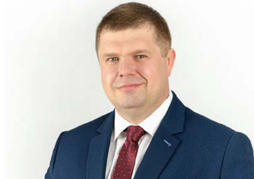
Wojciech Kałuża Wicemarszałek Województwa Śląskiego

– Aby zachować konkurencyjność, pracodawcy powinni inwestować w pracowników, pozwalając im podnosić kwalifikacje. Tylko w ten sposób będą bardziej efektywni. W naszym regionie