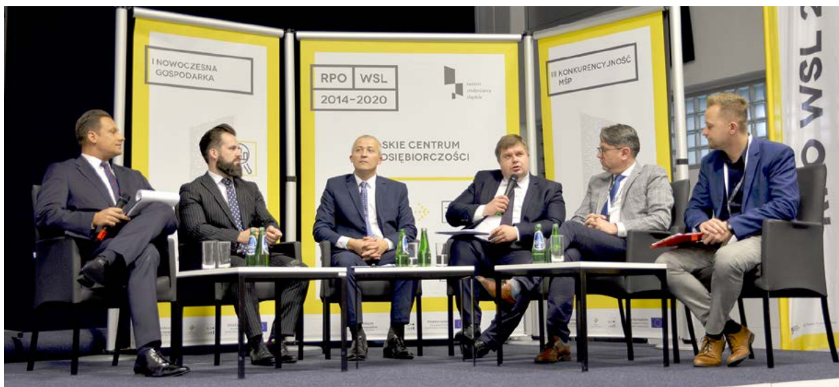
Konferencja była okazją do rozmów o przyszłości regionu w kontekście budowania gospodarki opartej o Fundusze Europejskie.