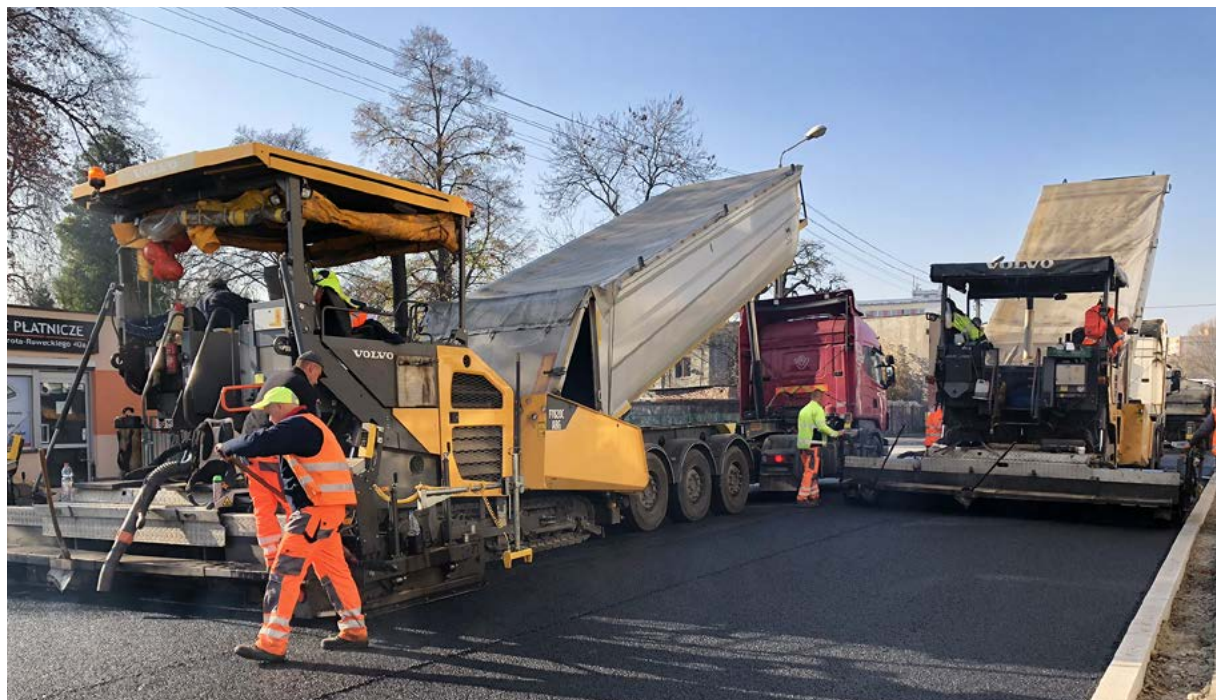
Silesia Invest sp. z o.o. opracowała ekologiczną mieszankę do wypełniania nawierzchni dróg.