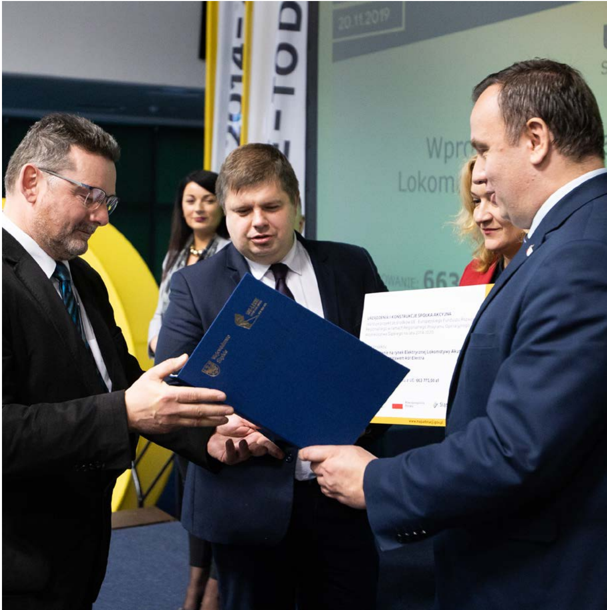
W trakcie spotkania przedsiębiorcy odebrali umowy na dofinansowanie przedsięwzięć w ramach RPO WSL 2014-2020.