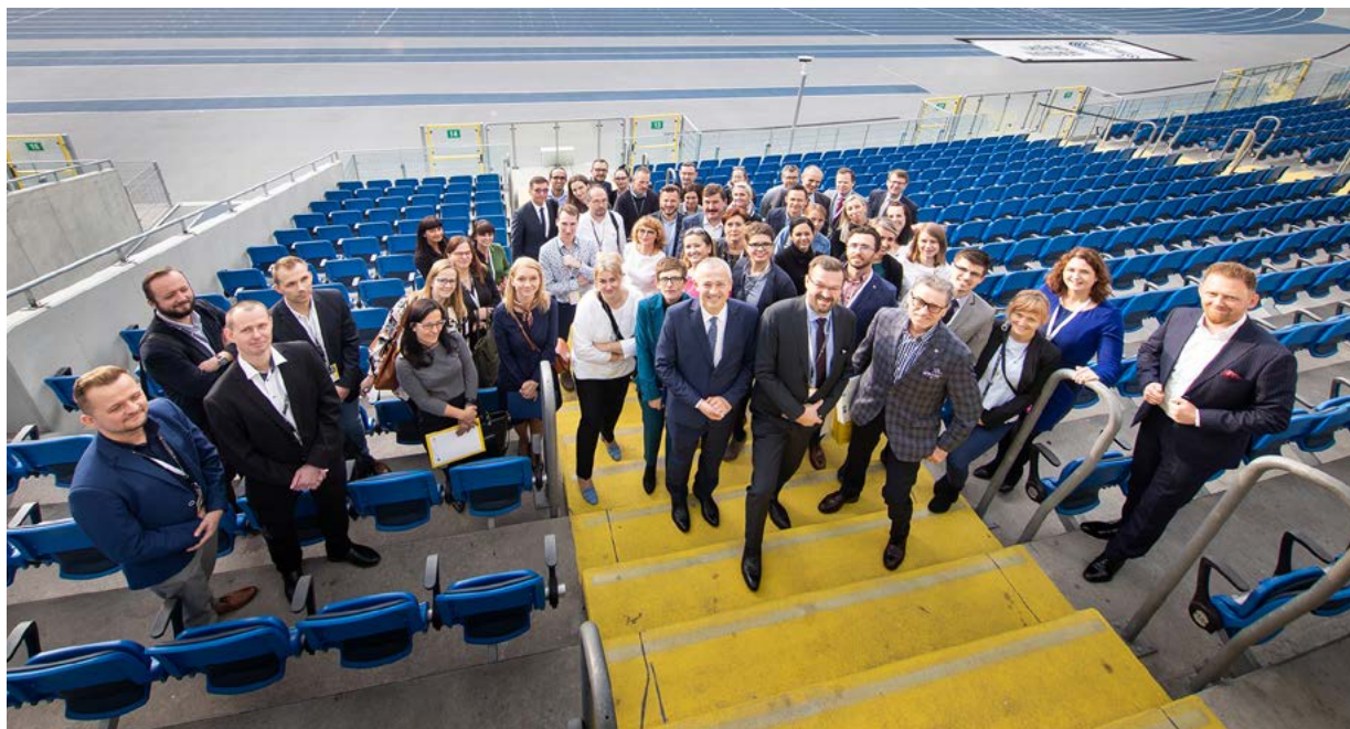
Stadion Śląski gościł ponad stu uczestników konferencji.